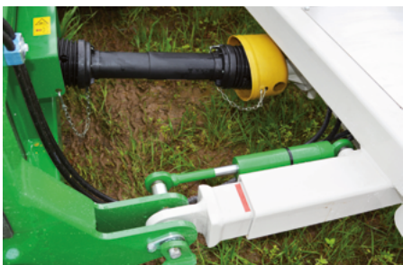
Direkter Antrieb – Getriebe auf Umsetzwelle