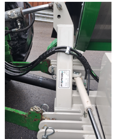
Anhängung an 3-Punkt vom Traktor