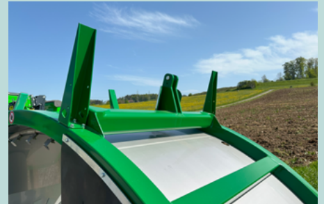
Vliesführung vorne / hinten

Das Vlies wird auf schmale Breite zusammengeführt, damit die Gase entweichen können. Die schwere Handarbeit bei nassem Vlies entfällt.