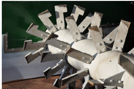
Eine gute Umsetzwelle arbeitet das Material von innen nach aussen. Durch schonendes Umsetzen können sich die Mikroorganismen überall optimal vermehren können.