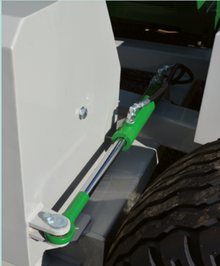
Seitengewicht schwenkbar (Bild TG 301)