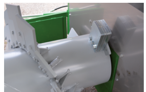
12 mm Schlägerdicke mit 3 Befestigungsschrauben. Die gewuchtete Welle sorgt für eine lange Lebensdauer.