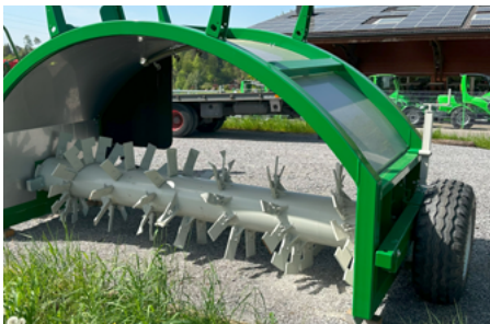
Die massive Bogenkonstruktion aus 6 mm Stahl sorgt für eine sehr grosse Stabilität.