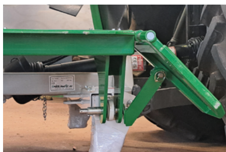
Anhängung an 3-Punkt Traktor