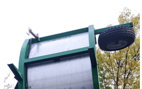
Für den Transport kann das Tastrad weggeschwenkt werden, keine Demontage nötig.