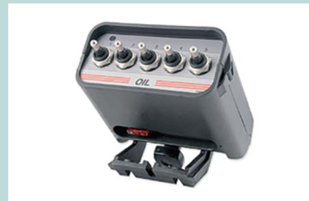
Bedienpult zu Selektionsventil Funktionen werden über Bedienpult bedient