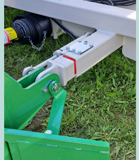
Hydraulischer Seitenversatz, damit die Miete da bleibt wo sie hingehört. (Bild TG 301)