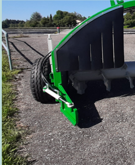
Zuführschild hydraulisch rechts