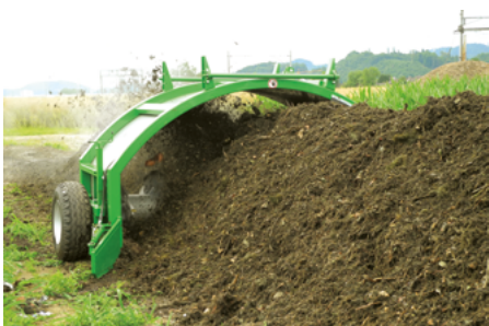
Maximale Mietengrösse: 3.3 x 1.5m (TG 303), damit aerob kompostiert werden kann.