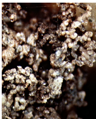
Perfekter Krümel Aufbau – mikroskopische Ansicht

Zudem speichert ein humusreicher Boden auf natürliche Weise CO 2 und schützt somit unser Klima.