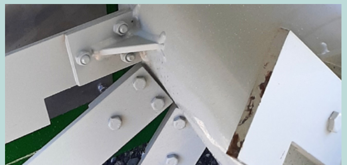
Lange Schlegel 260x80x15 - für schweres Umsetzmaterial von Vorteil

Hinweis: Für die länderspezifische Strassenzulassung ist der Käufer verantwortlich. Bitte sprechen Sie mit unseren Beratern.